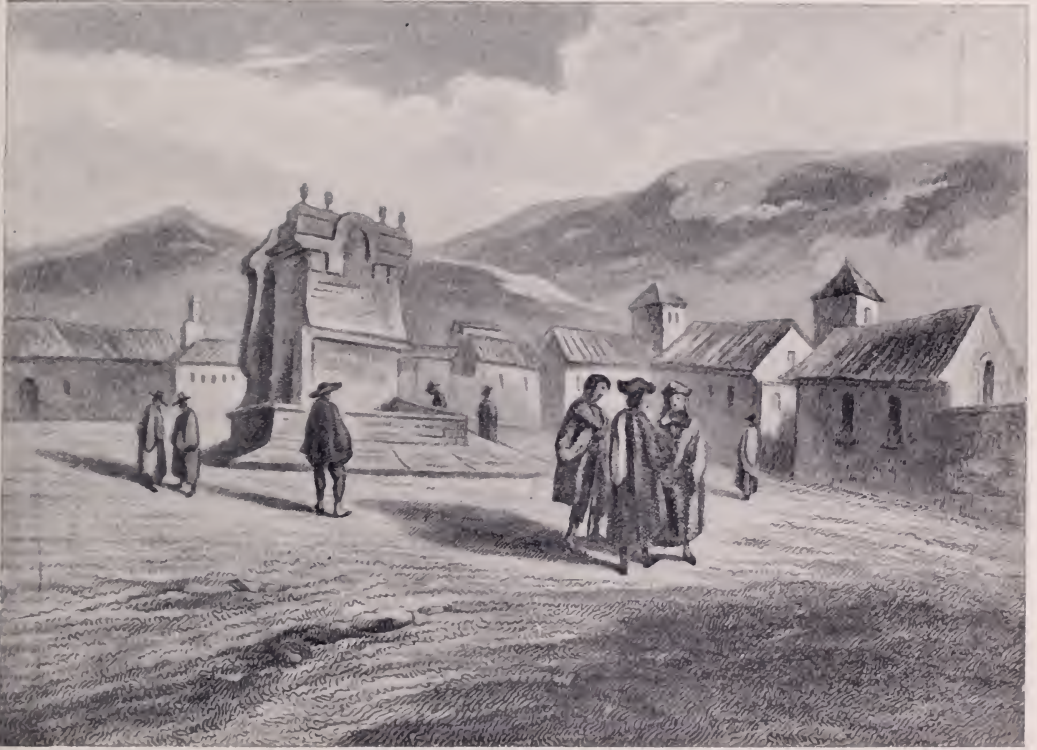
Santafé de Bogotá en la época del señor Barrios. (Grabado francés del siglo pasado).